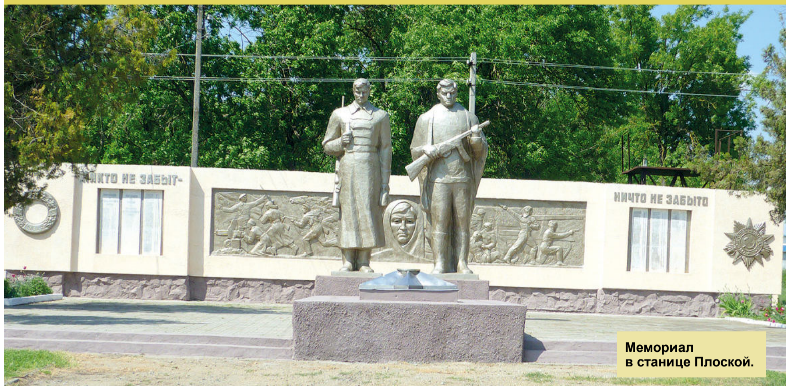
Мемориал в станице Плоской.